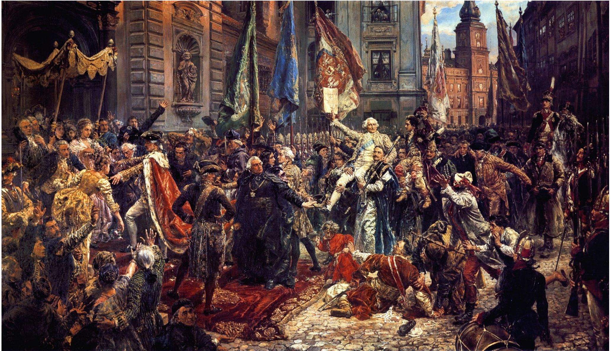
Konstytucja 3 Maja 1791 roku – obraz Jana Matejki wykonany w 1891 r. Jest artystyczną interpretacją momentu po uchwaleniu konstytucji.