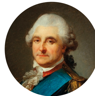
STANISŁAW AUGUST PONIATOWSKI

Wkład Stanisława Augusta Poniatowskiego w Konstytucję wciąż jest przedmiotem sporów. Był królem podporządkowanym Rosji, chętnym do reform w granicach, które tolerowała caryca Katarzyna II. Brał udział w tworzeniu i uchwaleniu Konstytucji, lecz gdy następnie do Polski wkroczyła rosyjska armia, przystąpił do konfederacji targowickiej, a ostatecznie zalegalizował III rozbiór Polski.