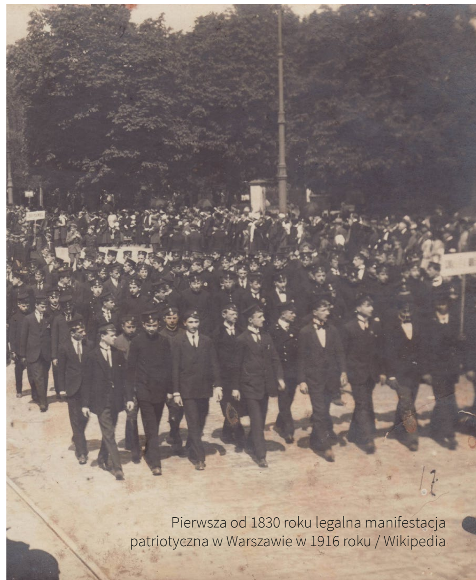
Pierwsza od 1830 roku legalna manifestacja patriotyczna w Warszawie w 1916 roku

Konstytucja 3 maja stała się symbolem dążenia do niepodległości, refleksji i chęci naprawy państwa , do którego Polacy odnosili się w czasach zaborów. Została uchwalona zbyt późno, by uratować Polskę przed utratą niepodległości, jednak była mądrą i nowoczesną formą naprawy wadliwego ustroju, a zarazem drugą (po amerykańskiej) spisaną konstytucją na świecie.