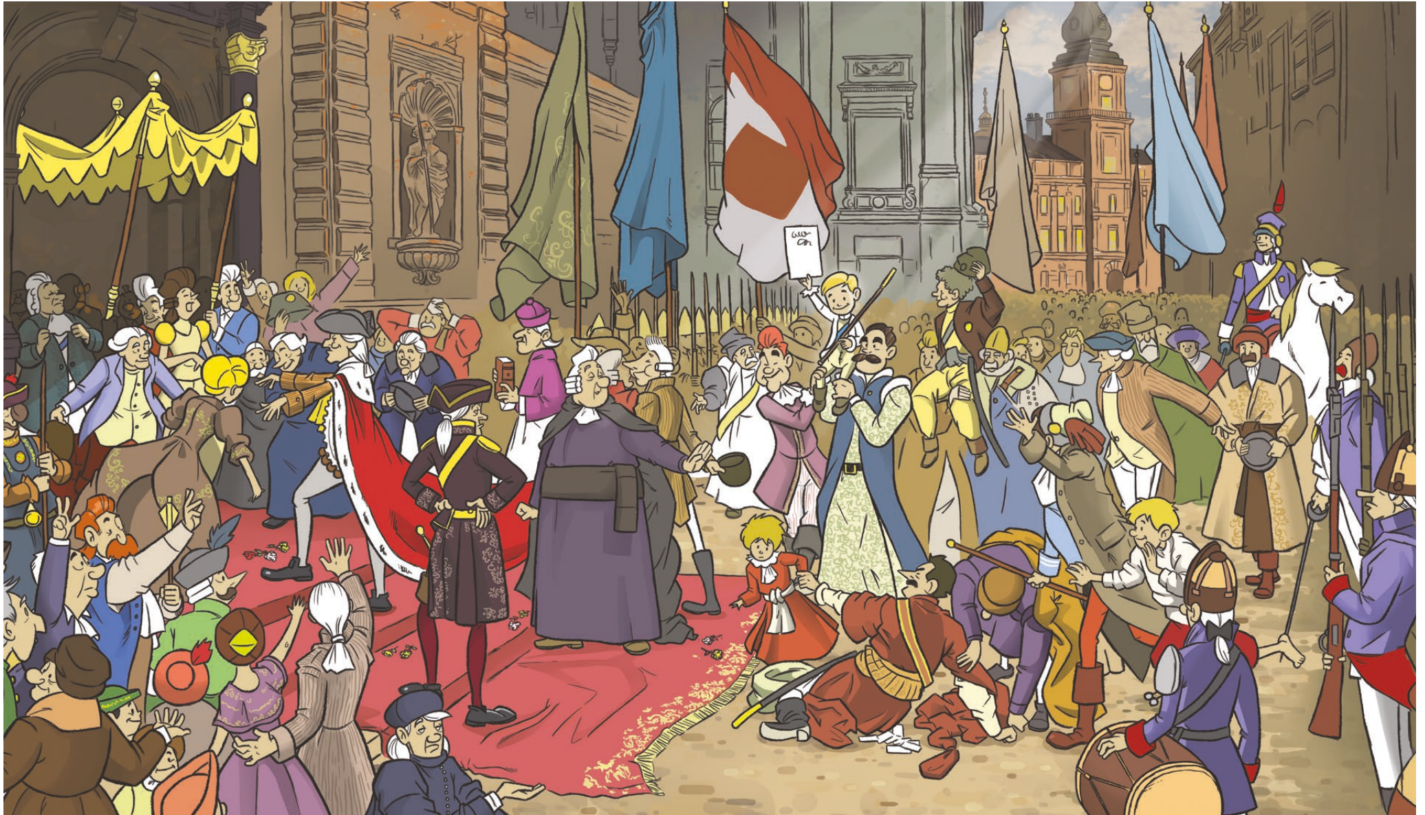
Konstytucja nie należy do rządzących i historii. Jest Twoja – ilustracja Sebastiana Szpakowskiego wykonana na podstawie obrazu Jana Matejki.